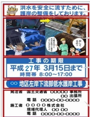
マンガによる新しい工事標識板