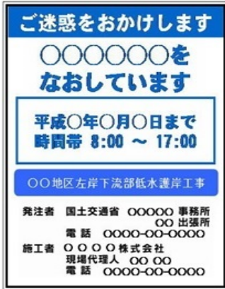
従来の工事標識板